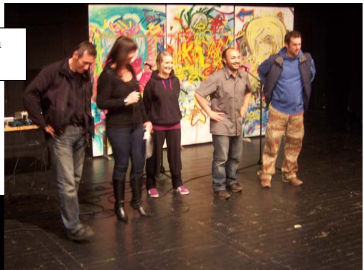
Die Künstler vom Abraxxas